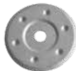
MDSB - горячеоцинкованная сталь