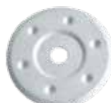
MDSB - нержавеющая сталь A2